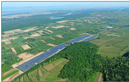
Der Solarpark Vogtsburg blickt auf ein erfolgreiches Jahr 2019 zurück.

Vogtsburg. Die für Mai geplante Generalversammlung der Bürgerenergiegenossenschaft Solarpark Vogtsburg eG konnte aufgrund der Covid-19-Pandemie und den damit einhergehenden Einschränkungen nicht wie geplant stattfinden. Dennoch sollen die Mitglieder der Bürgerenergiegenossenschaft die Auszahlung der Dividende wie in der Vergangenheit im gewohnten Zeitraum erhalten, teilte der Vorstand der Bürgerenergiegenossenschaft mit. Vorstand und Aufsichtsrat haben die dafür notwendigen Voraussetzungen per Umlaufbeschluss geschaffen.